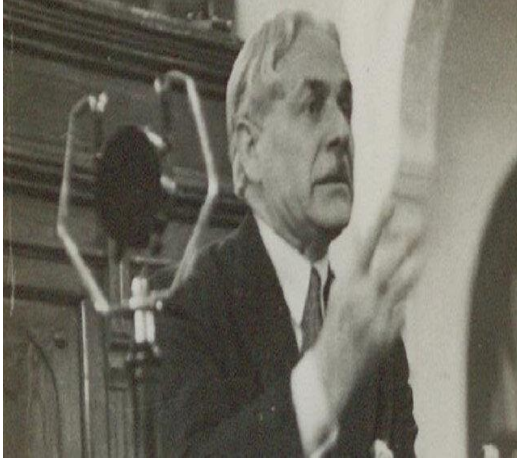
Hamdullah Suphi Bey

(Haberin başı sayfa 1’de) ... 1920 yılının son baharında bunun için bir yarışma başlattı.21 Aralık’a kadar 3 aylık süre verilmişti.Ödül ise tam 500 lira. Meclis kurulduktan nerdeyse hemen sonra başlayan bu yarışmaya rağbet epey büyük ,724 şiir katıldı ama hiçbiri istenen niteliği karşılamıyor, karşılayamıyor. Bu günleri kimse yeterince anlatamıyor . Nerede diriliş , nerde kudret? Sahi nerede Mehmet Akif? Nerde millî mücadeleye genç,yaşlı,kadın,erkek herkes katılmalı diyen şair?